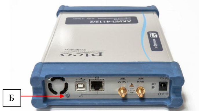
Рисунок 2 – Вид задней панели и схема пломбировки от несанкционированного доступа (Б)